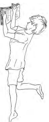
Так лучше усваивается

Но факт остается фактом, ту ответственность, которую мы взяли на себя при его рождении, мы пытаемся разде-